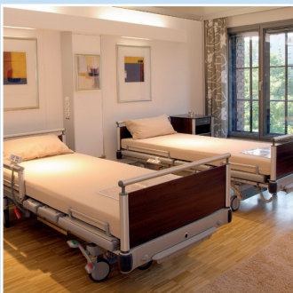
Hospital-Galeria – Patientenzimmer der Zukunft.