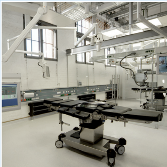
„Der Gläserne OP“ – Integrierte OP-Lösungen der Zukunft