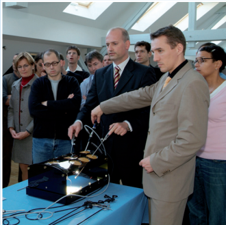
„medicallounge-academy“ zertifizierte Fortbildung